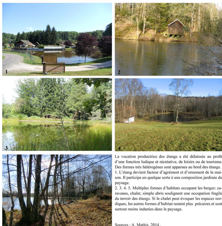
Figure 2. Les nouveaux usages des étangs : des lieux de loisirs individuels