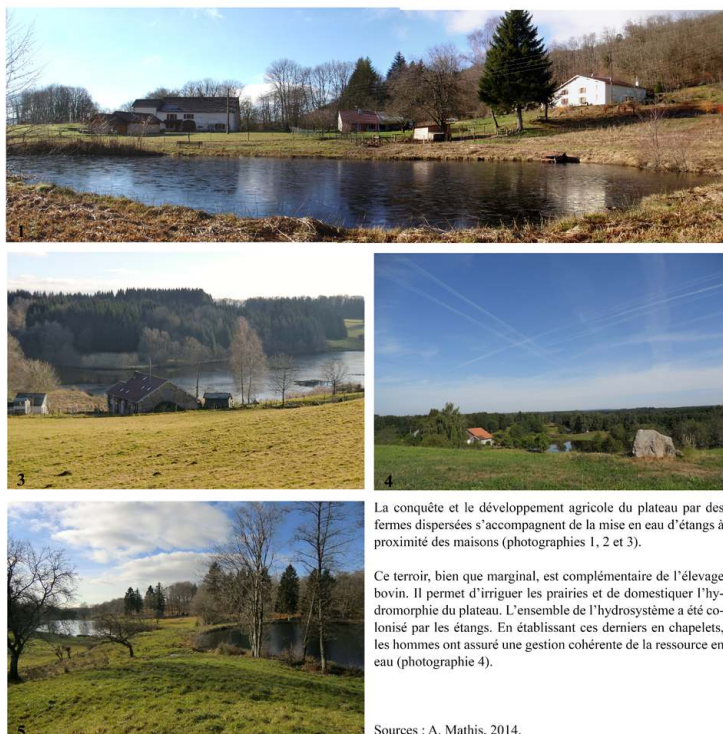
Figure 3. Un paysage de fermes isolées avec son terroir d'étangs.

La conquête et le développement agricole du plateau par des fermes dispersées s'accompagne de la mise en eau d'étangs à proximité des maisons (photographies 1, 2 et 3).