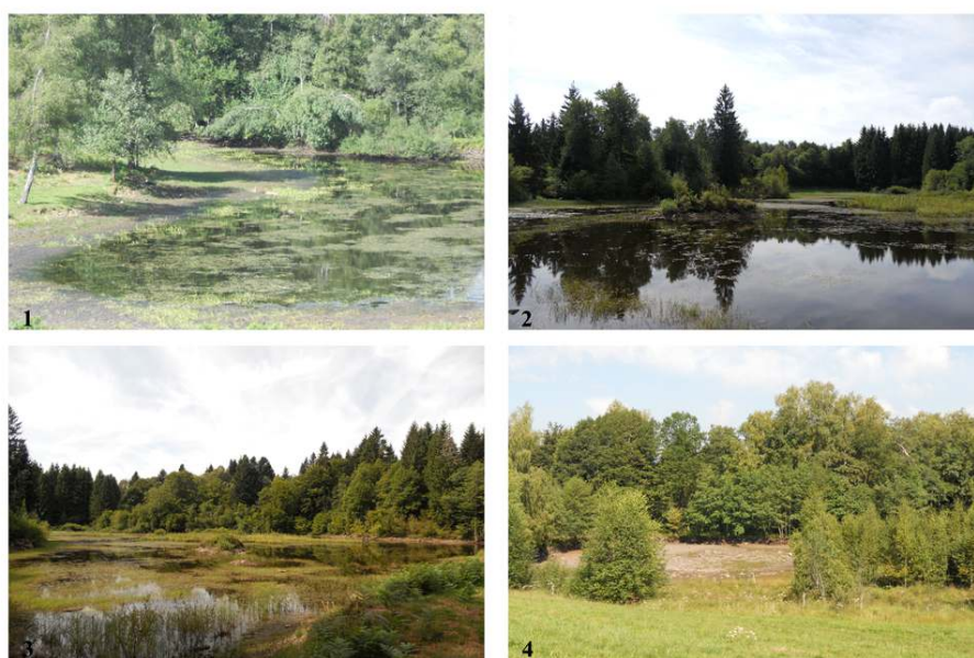
Figure 5. Les paysages d'étangs au sein du cycle de la déprise anthropique

Le terroir des étangs du plateau se révèle particulièrement fragile. La faible profondeur en eau laisse « fleurir » la surface de l'étang et souligne l'origine de l'aménagement d'anciennes tourbières et de zones marécageuses (photographies n°1, 2 et 3). Ces vues illustrent les dynamiques en cours. Ainsi ces étangs, qui sont déjà repris dans un cycle naturel aboutissant à un nouveau stade de type tourbière. La photographie n°4 montre l'abandon d'un étang et l'effacement de la zone humide.